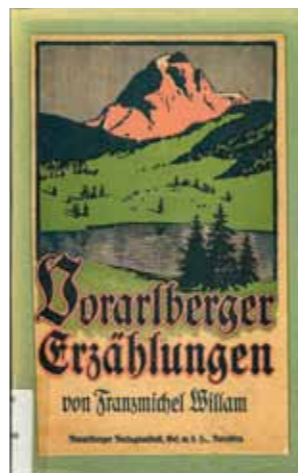
Franz Michel Willams erster Band mit Erzählungen, 1921