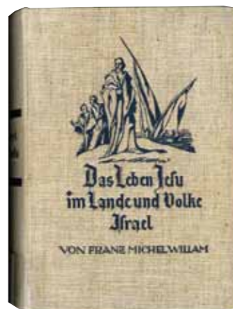
Franz Michel Willam „Das Leben Jesu“ 1933

Willam, der wandernde Beobachter und Sammler auf den Spuren Jesu, betreibt auf seine Art historisch-kritische Forschung, indem er in „Überblicken“ historische und archäologische Erläuterungen zum Leben Jesu gibt und mit Beschreibungen der Lebensformen, der Landschaft, des Klimas, der Vegetation dem Leser das Land nahebringt. 1930 beginnt Willam in Müselbach mit der Aufarbeitung des Materials, 1933 liegt „Das Leben Jesu im Lande und Volke Israel“ fertig vor und erlebt bis 1937 sieben Auflagen. Nach dem Zweiten Weltkrieg erscheint die achte Auflage (1949), 1960 die zehnte und bislang letzte (64. – 66. Tausend). Internationale Berühmtheit erlangte Willam mit insgesamt zwölf Übersetzungen des „Leben Jesu“.